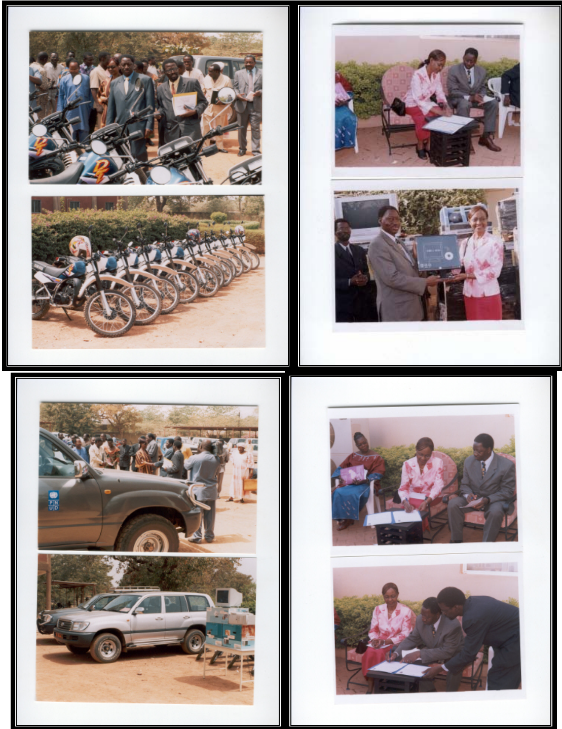
Cérémonie de remise de véhicules, de motos et de matériels NTIC par le PNUD au MEBA (PPIE)