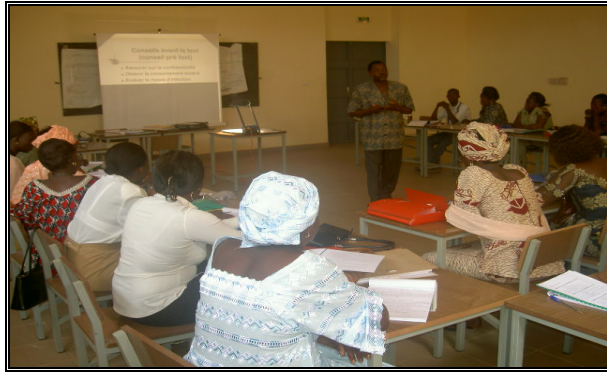
Renforcer les capacités des acteurs de l'éducation (Atelier de formation des maîtres expérimentateurs des nouveaux curricula à Fada)