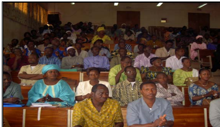
Formation pédagogique des acteurs (encadreur et enseignants) à Bobo