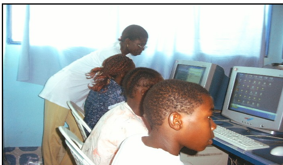
Lutter contre les IST/VIH/SIDA au moyen des TIC , tout en installant des compétences techniques indispensables à l'épanouissement de l'enfant.