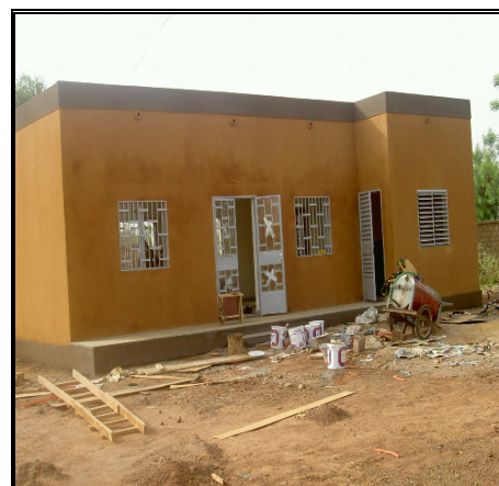
Cybersalle construite au niveau des 15 sites pilotes