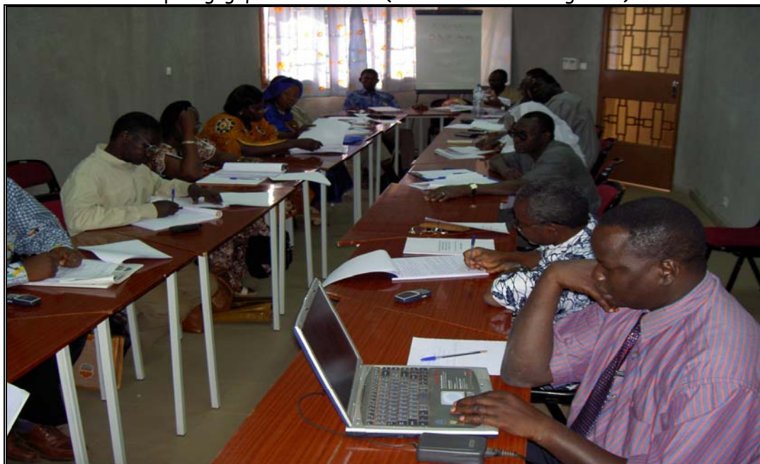
L'élaboration des curricula par une équipe pluridisciplinaire qui a planché de Septembre à Décembre 2004