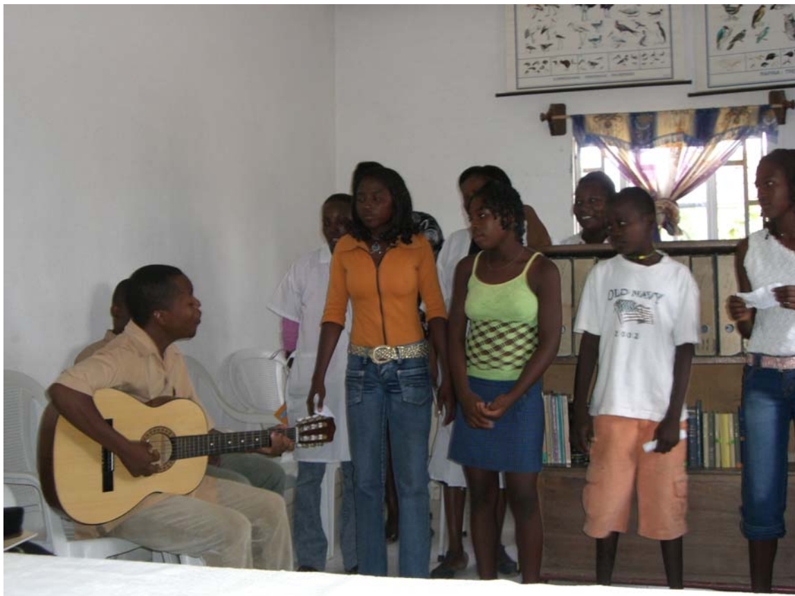
Grupo de estudantes - Kuanza Sul – fev.2007

Visitei os NPES do Bengo e de Kuanza Sul acompanhada pelo Coordenador Pedagógico do Projecto, actual responsável pelas articulações com os NPES. Para as visitas, foi solicitada uma reunião de cada Núcleo. Como seria difícil realizar várias entrevistas individuais devido ao tempo, achei que poderia ser mais produtivo realizar um grupo de discussão, como mencionado na avaliação de meio-termo (Grangeiro, 2005). Apesar da boa recepção dos Directores Provinciais de Educação, optei por entrevistar os pontos focais por serem o elo de ligação entre a Coordenação Nacional do Projecto, o Director Provincial e os actores sociais que compõem cada núcleo.