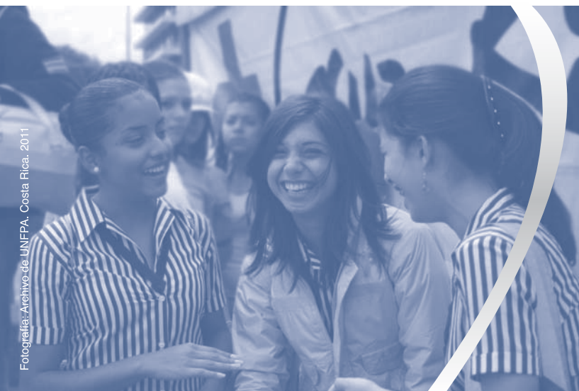
Fotografía: Archivo de UNFPA, Costa Rica. 2011

En tanto se respete la autonomía, la autodeterminación, la diversidad de de las personas y los derechos la atención a los asuntos ligados a sexualidad y reproducción se entenderán desde una perspectiva holística e integral. Para el efecto, se necesita además la implementación de un programa de educación para la sexualidad en el sistema educativo, libre de prejuicios, que promueva información veraz, científica y laica, y que estimule el respeto por la diversidad y la pluralidad de la sociedad costarricense. Esto como una manera de asegurar la posibilidad de las personas de construir una sexualidad libre y placentera.