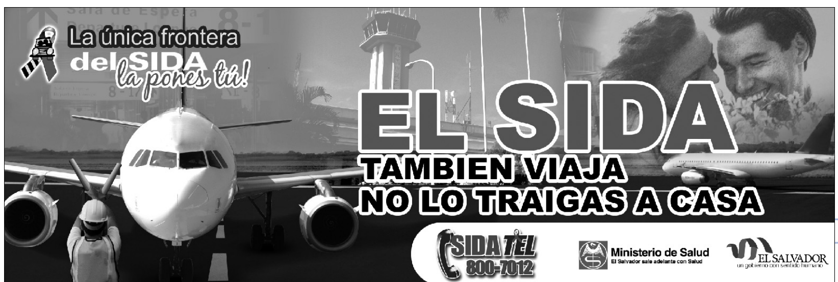
Muestra de Afiches ubicados en los diferentes puntos fronterizos: Fronteras terrestres, Puertos, Aeropuerto y Estaciones de Paso