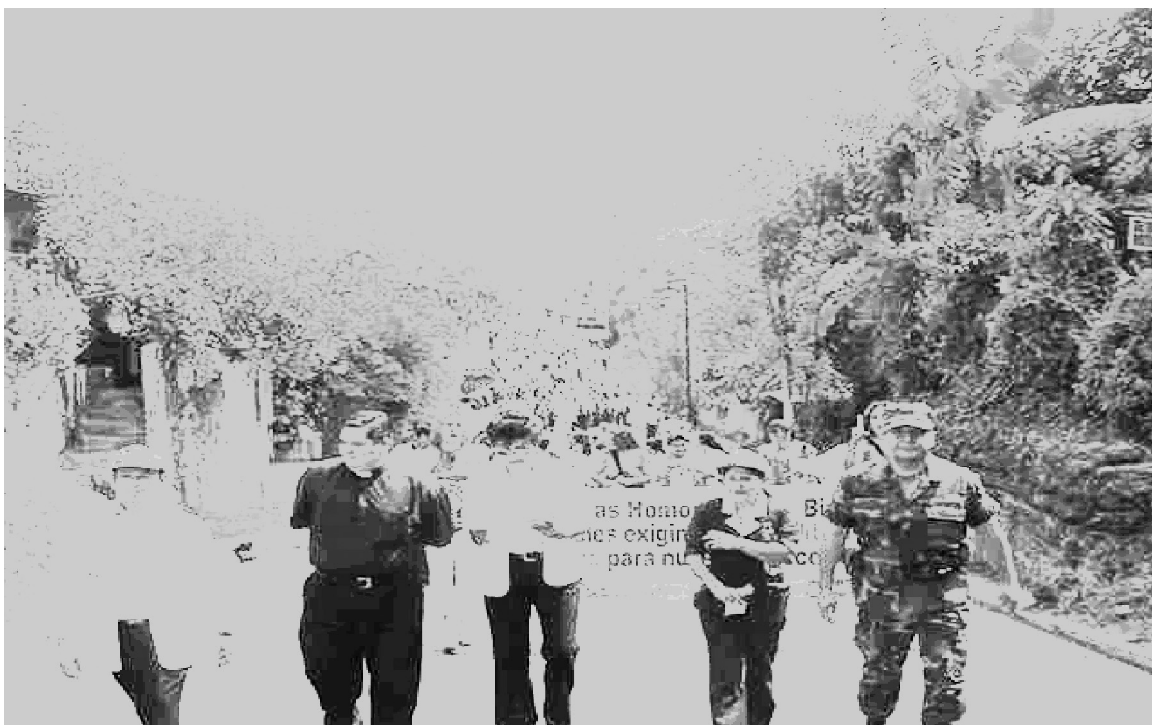
Movilización Social en la lucha contra las ITS/VIH/SIDA, Lourdes, Colón.